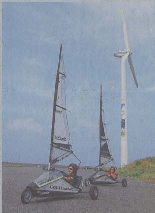
風を感じながら操縦するプロローカート。意外と簡単だった。茨城県神栖市